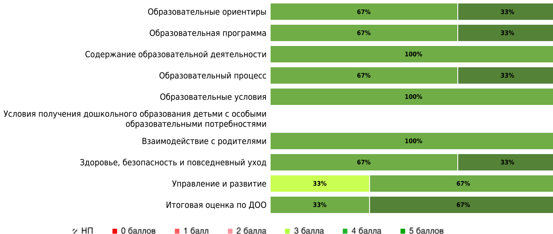
Доли ДОО с разными баллами (степень удовлетворенности родителей)

Результаты оценки качества образования в ДОО субъекта РФ с точки зрения родителей/законных представителей (степень удовлетворенности) по областям качества (по 5-балльной шкале):